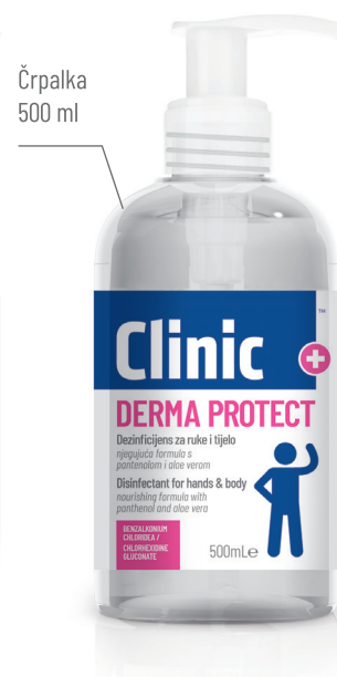
Črpalka 500 ml