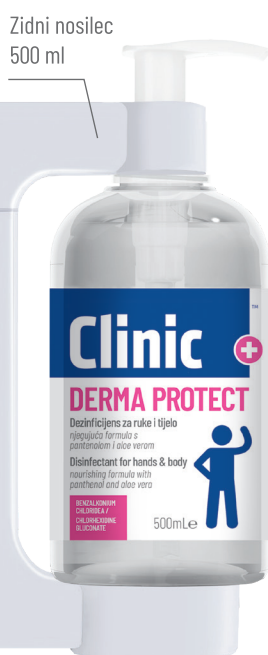
Zidni nosilec 500 ml