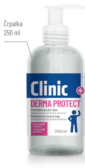
Črpalka 250 ml